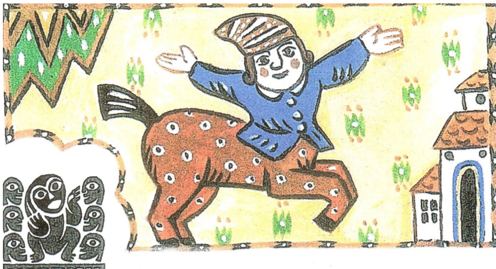
Illustration av Mats Rehnman 2000